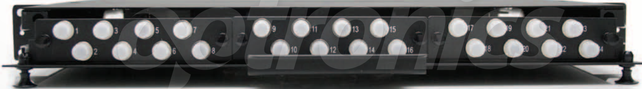
Distribución de colores en paneles. Vista frontal