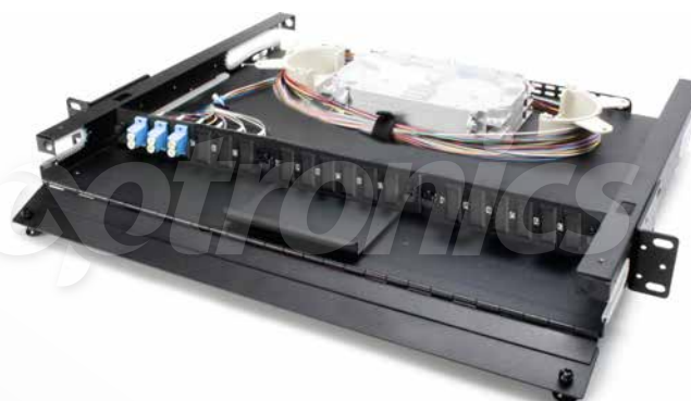
*Imagen del producto sólo representativa

Los 3 paneles modulares de capacidad de hasta 18 puertos LC dúplex pueden ser configurados en cualquier combinación disponible; cuenta con accesorios para ordenar las fibras