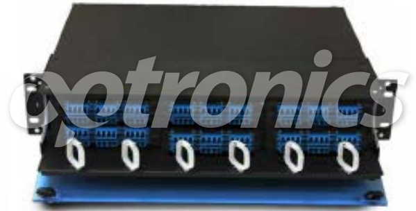
*Imagen del producto sólo representativa

Los 6 paneles modulares están configurados con 36 acopladores LC quad para un total de 144 puertos y fibras, pueden ser configurados en cualquier combinación disponible; cuenta con accesorios para ordenar las fibras.