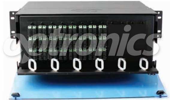
*Imagen del producto sólo representativa

Los 12 paneles modulares de capacidad de hasta 144 puertos son configurados con 48 acopladores SCU dúplex monomodo.