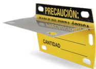
Etiqueta con autolaminado OPHEMAEA8951YY