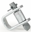
Herraje tipo D OPHAHEDAC