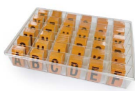
Etiqueta reflectiva OPHEMAERK