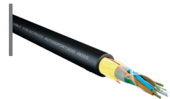
Cable exterior ADSS span 100 m Monomodo OPCFOCE09SA144B3B