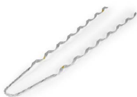
Remate preformado OPHARPALSA109119