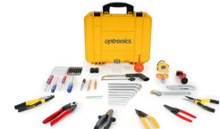
Kit para preparado e instalación de fibra óptica exterior OPHE6300N