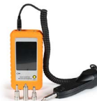
Microscopio con pantalla 3.5" OPEMFVM100