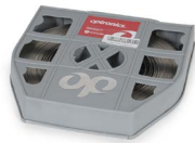
Fleje de acero 3/4" OPHAFLEAI07034