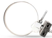
Herraje tipo grapa de bajada en poste OPHAGRBAPO13