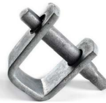
Herraje tipo "D" fleje individual OPHAHEDAC1FCH