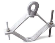
Abrazadera de 8" con ojillo de forja OPHAAB8ACH0J