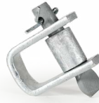
Herraje D OPHAHEDAC