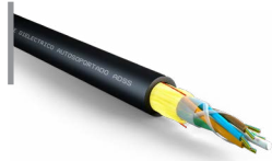
Cable Exterior ADSS span 100 y 200 m OPCF0CE09SAXXB3B