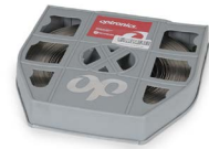
Fleje 5/8" OPHAFLEAI07058