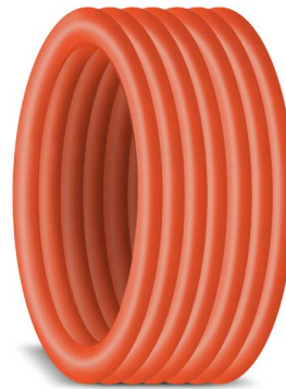
*Imagen solo representativa