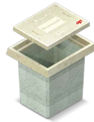
Registro de Telecomunicaciones OPRETECPL1T95T