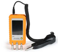
Microscopio de inspección OPEMFVM100