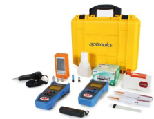
Kit de medición y limpieza OPHEKMELINT