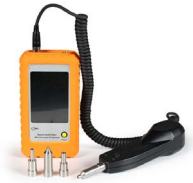
Microscopio de inspección OPEMFVM100