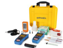
Kit de medición y limpieza OPHEKMELINT