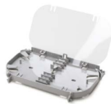
Charola de empalme OPCEHH024