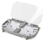
Charola de empalme OPCECHH024