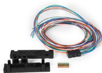
Fan Out Kit de 12 fibras OPMIFOK1236