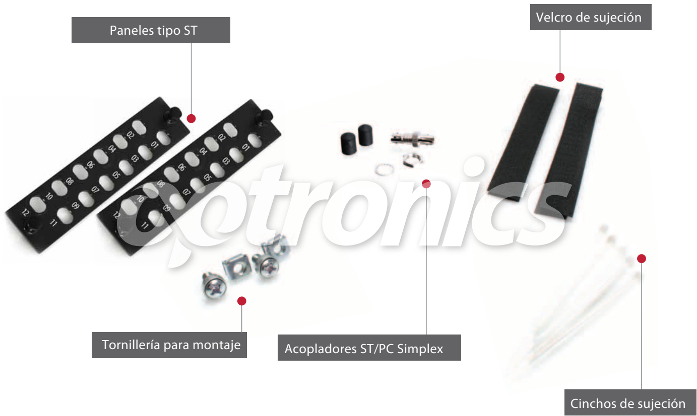
Paneles tipo ST

En lo subsecuente se muestran el kit de accesorios.