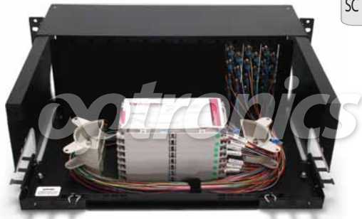
*Imagen del producto sólo representativa