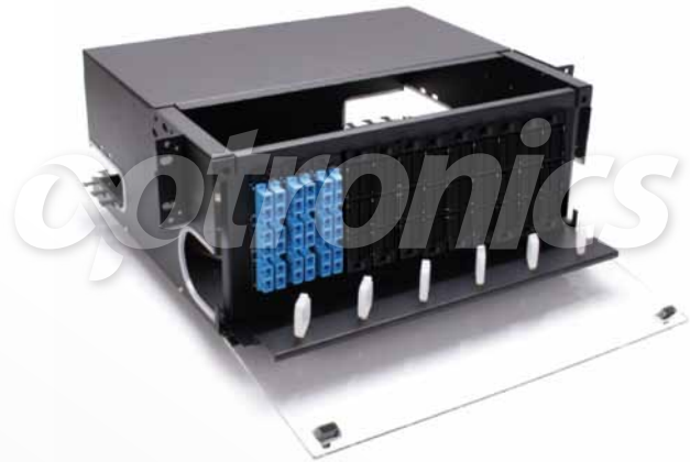
*Imagen del producto sólo representativa

Tienen alto desempeño y calidad en los ensambles de los paneles y acopladores, disponibles en cualquier combinación.