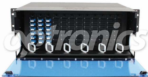
*Imagen del producto solo representativa

Los 12 paneles modulares de capacidad de hasta 144 puertos cuentan con 18 acopladores tipo LC dúplex Monomodo.