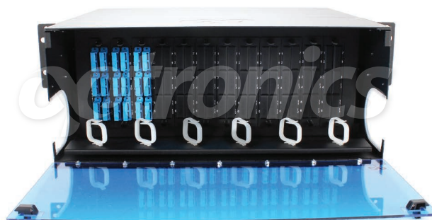
*Imagen del producto sólo representativa

Los 12 paneles modulares de capacidad de hasta 144 puertos son configurados con 18 acopladores SCU dúplex con 36 Pigtaills de fibra Monomodo, ofrecen excelente rendimiento óptico en inserción y retorno.