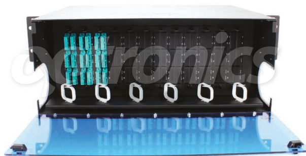
*Imagen del producto sólo representativa

Los 12 paneles modulares de capacidad de hasta 144 puertos son configurados con 18 acopladores SCP dúplex con 36 Pigtaills de fibra Multimodo OM4, ofrecen excelente rendimiento óptico en inserción y retorno.