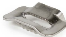
Hebilla para fleje de 5/8 OPHAHEBAI58