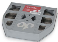
Fleje de acero inoxidable de 5/8 OPHAFLEAI07058