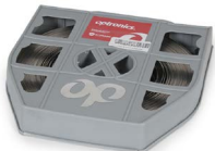
Fleje de acero inoxidable de 5/8 OPHAFLEAI07058