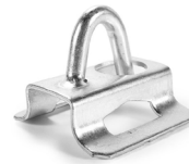
Herraje de sujeción a poste OPHAHESURD