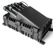
Cierre de empalme QuickNap 8 acopladores SC sx y splitter 1x8 SCA OPCEF08SC36E65HT8SCA