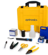
Kit ensamble de conectores mecánicos OPHE021FT