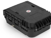
Caja de empalme segundo nivel FTTx OPCEF16SC65HT