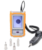
Microscopio con pantalla LCD de 3.5" OPEMFVM100