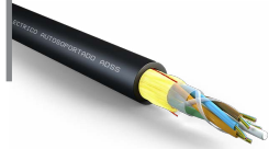
Cable exterior ADSS span 100 m monomodo 3200 N OPCFOCE09SAXXB3B