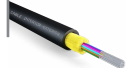
Cable interior-exterior monomodo OPCFOIE09RXX