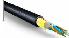
Cable exterior ADSS PBT span 100 monomodo 2700 N OPCFOCE09SAGXXB2B