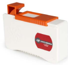
Casete limpiador de férulas OPHECCASETEG