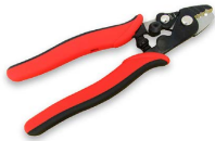
Pelador profesional de 3 posiciones OPHES144HT