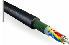
Cable exterior armado multitubo monomodo OPCFOCE09ARXXPPSS