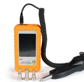
2. Microscopio de inspección