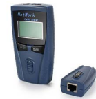
Probador cables de red OPEMPTP