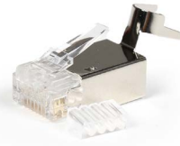
Plug blindado RJ45 Cat6 & 6A aislamientos 1.2 mm OPCAJRJ45B66A12