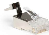
Plug blindado RJ45 Cat6 & 6A aislamientos 1.5 mm OPCAJRJ45B66A15